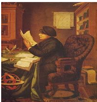
Портрет на Петър Берон