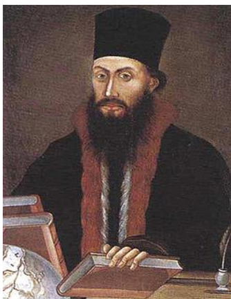
Неофит Рилски – български просветен деец

Израз на голямото значение на училището и просветното дело за българския народ е включването на двадесет и четвърти май в националната празнична система. Първите известни свидетелства за честването на празника са открити в арменски летопис от 1813 година, където се споменава за честване на светите братя на 22 май 1803 г. в Шумен. За първи път на 11 май 1851 г. в епархийското училище „Св. св. Кирил и Методий“ в гр. Пловдив по инициатива на Найден Геров се организира празник на Кирил и Методий – създатели на глаголицата. Денят 11 май не е случайно избран от Найден Геров – това е общият църковен празник на двамата светии. Във възрожденската ни книжнина първите известия за празничното почитане на Кирил и Методий на 11 май, се срещат в "Христоматия славянского языка" от 1852 г. на Неофит Рилски.