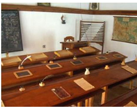
Взаимното училище в Златоград /днес музей/