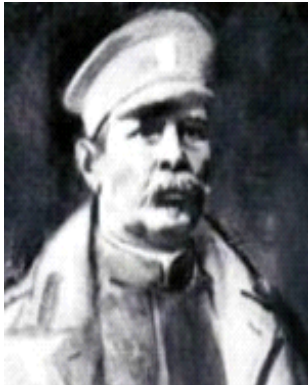
Полковник Серафимов – освободителят на Родопите

Чувствително намалява броят на учениците, които посещават училище. В Момчиловци от 199 ученици само една четвърт посещават училище. Подобна е картината и в други училища в околията.