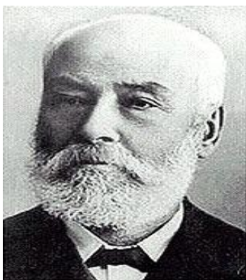
Найден Геров- български просветен деец и писател. Съставител на първия български двуезичен тълковен речник в 6 тома.

През 1846 година Найден Геров основава класно училище в Копривщица, а през 1850 година класното училище в Пловдив, което се нарича "Св. св. Кирил и Методий".