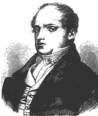
Портрет на Васил Априлов

Стремежът е да се освободи българското училище от гръцко влияние и да е в услуга на житейските нужди. Тук ще получи своята реализация и Неофит Рилски, който съставя първите взаимоучителни таблици.