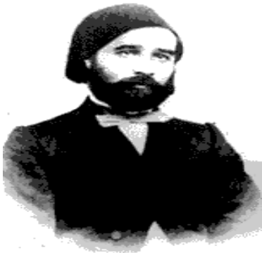
Йоаким Груев – български просветител

Според Привременния устав за народните училища от 1878г. училищата са народни и тяхната система включва три степени : първоначална с тригодишен курс на обучение, средна – с двегодишен курс и главна – с четиригодишен курс. Обучението в първоначалните училища е задължително и безплатно, отделно за момчетата и за момичетата. Средните и главните училища се откриват в по-големите и богати градове и общини. Управлението на училищата, контрола и методическото ръководство се осъществява от училищните настоятелства, Окръжните инспекторати и Дирекция за просвещение и духовните дела. Във васалната провинция Източна Румелия се изгражда сходна структура на училищата с Княжество България. Тя включва четиригодишно задължително първостепенно училище и двегодишно второстепенно училище. В по-големите селища се изграждат средни класове с четиригодишно обучение и горни класове с тригодишно обучение. В Източна Румелия за Директор на народното просвещение е назначен Йоаким Груев. Той създава "Органически устав", по който се организират училищата и налага три принципа – равноправие, автономия и децентрализация, характерни за устройството на образователната система през 1880 г. и регламентирани със Закон за началното учение от 1880 г. За първи път се назначават училищни инспектори, които координират дейността в училищата. Схемата на средното образование е 4 плюс 4 плюс 3 години – общо 11 г.