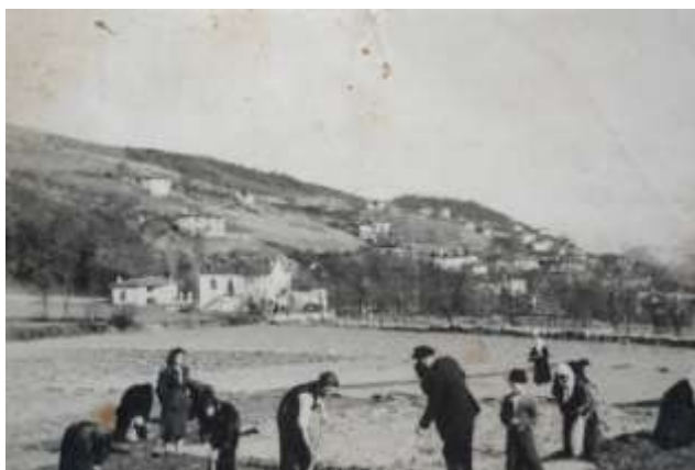
Ученици се трудят в опитното поле на училището – 1939 година